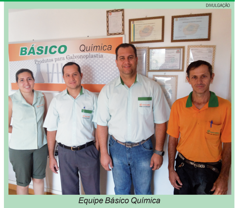
Equipe Básico Química

grande sucesso e com uma filial em Juazeiro do Norte – CE, não deixe de conhecer os mais modernos conceitos que a empresa oferece na cidade. Sua sede fica na Rua da Imprensa, 674, Pq Novo Mundo. O horário de atendimento é de segunda a sexta-feira, das 7h30 às 12h e das 13h às 17h30. Entre em contato também pelo telefone (19) 3444-9673. “Venha conhecer os melhores produtos para galvanoplastia da região”, convida o proprietário.