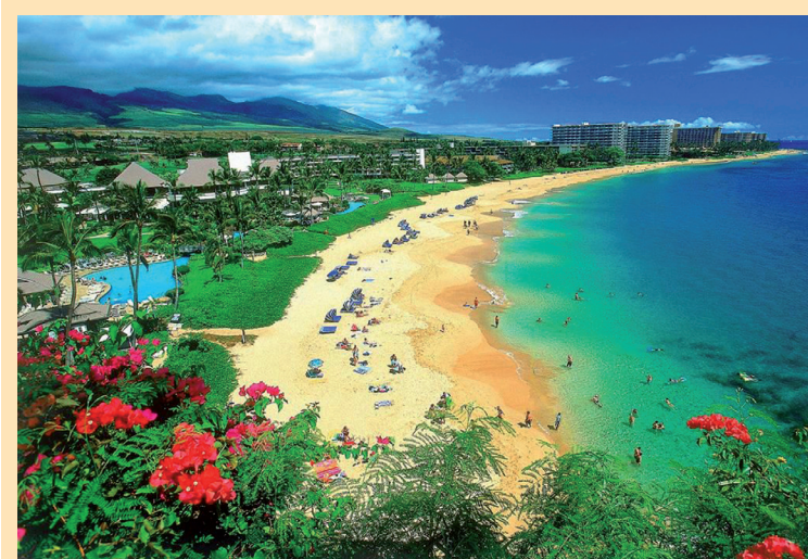
Em Maui, sempre existe algo divertido e energizante, algo histórico e cultural, algo extravagante, algo de beleza deslumbrante

tradicional e contemporânea das ilhas havaianas. Com centro histórico e a mundialmente famosa Waikiki Beach, Honolulu oferece aventuras ao ar livre como o surfe, caminhadas, lojas de