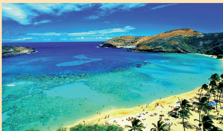
Honolulu é o centro da vida tradicional e contemporânea das ilhas havaianas

Pode-se dizer que o Havai seja o destino mais exótico dos Estados Unidos, com geografia e cultura únicas, que não se encontram em nenhum outro lugar da terra. Cada ilha tem a sua própria identidade cultural e oferece ao visitante uma experiência diferente, seja se encantar com a beleza natural exuberante de Kaua'i, aprender a surfar na praia de Waikiki em O'ahu, explorar uma comunidade de artistas na cidade de P'ia em Maui ou fazer uma caminhada até uma cascata isolada na Big Island.