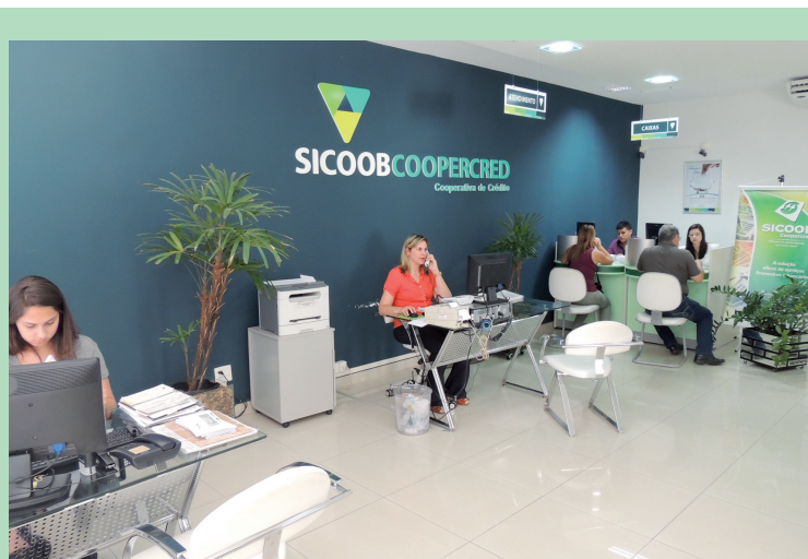
Os novos serviços do Sicoob-Acicred são o CDC Veículo e Adiantamento dos Recebíveis do Cartão de Crédito

A cooperativa de crédito empresarial tem agências em Americana, Limeira e Itacemópolis e oferece vantagens especiais