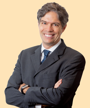
Ricardo Amorim Economista

Em resumo, caso se materializem, choques financeiros poderiam causar quedas fortes de preços das commodities agrícolas no final deste ano ou no ano que vem, mas por outro lado, se não se materializarem, o El Niño, tem uma probabilidade grande de ocorrer, deve causar altas dos preços agrícolas. Nesta queda de braço entre pressões baixistas e altistas, a volatilidade de preços agrícolas no restante deste ano e no próximo deve ser bastante grande. Prepare-se enquanto é tempo.