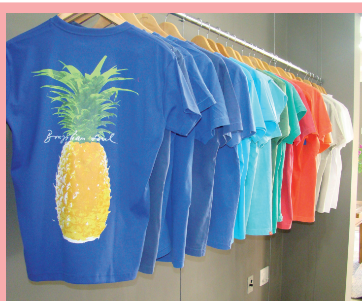
Na primavera/verão deste ano, cores vibrantes e fortes chamam a atenção dos homens