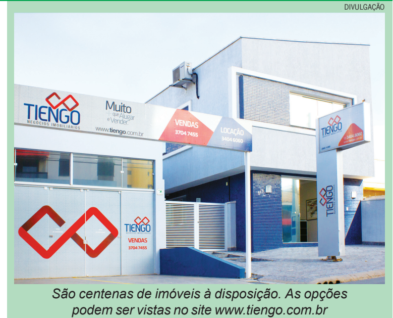
São centenas de imóveis à disposição. As opções podem ser vistas no site www.tiengo.com.br

Atualmente cerca de 20% dos negócios gerados na região de Limeira acontecem por meio da Tiengo, que ao longo de seus 20 anos construiu um histórico de idoneidade e credibilidade, e esse é um dos segredos do sucesso. “O maior patrimônio da empresa é a confiança de nossos clientes e parceiros, pois todos têm a mesma ideia de respeito e seriedade. Assim, conseguimos melhorar os resultados de todos os envolvi-