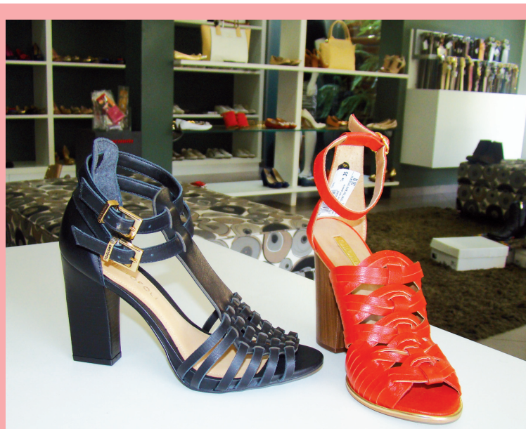
Nos calçados, os saltos grossos são a aposta da estação