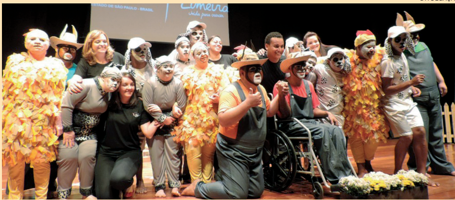
A cerimônia teve a apresentação dos alunos com o tema "Todos juntos somos fortes"