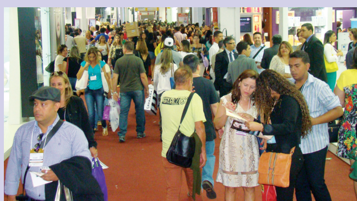
A feira recebeu 1000 marcas nacionais e estrangeiras de cosméticos, acessórios e tratamentos estéticos e contou com mais de 100 atividades simultâneas